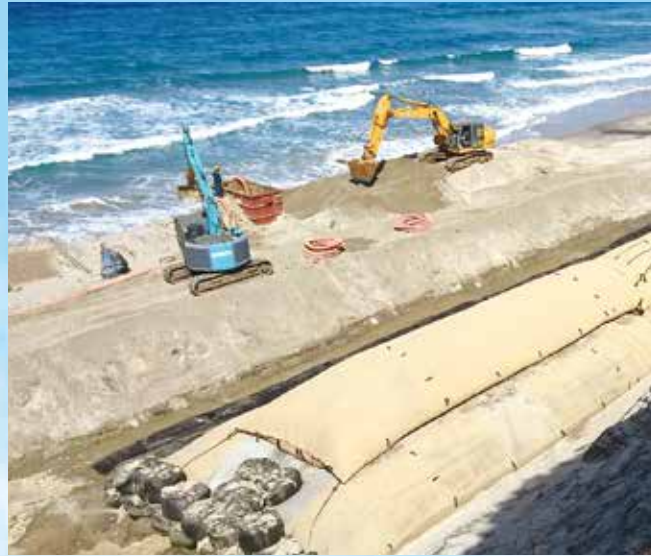
浜の用心棒 ジオチューブ