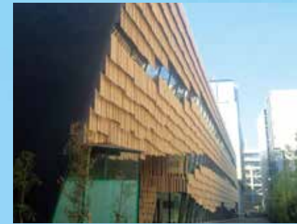
ノンロット® を木のパネル1枚1枚に