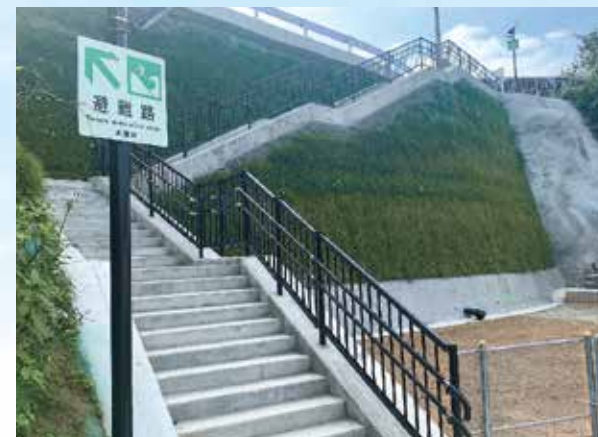
避難路の盛土にもテンサー®