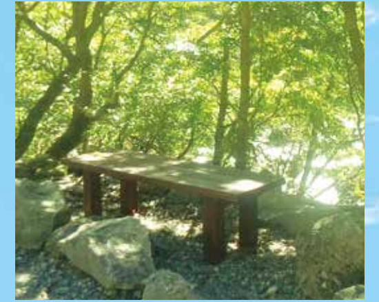
屋久島へノンロット® 塗布のベンチを寄贈