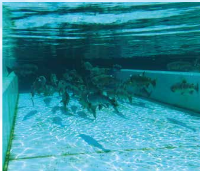
鮭が泳ぐスワエール® 施工の養殖施設