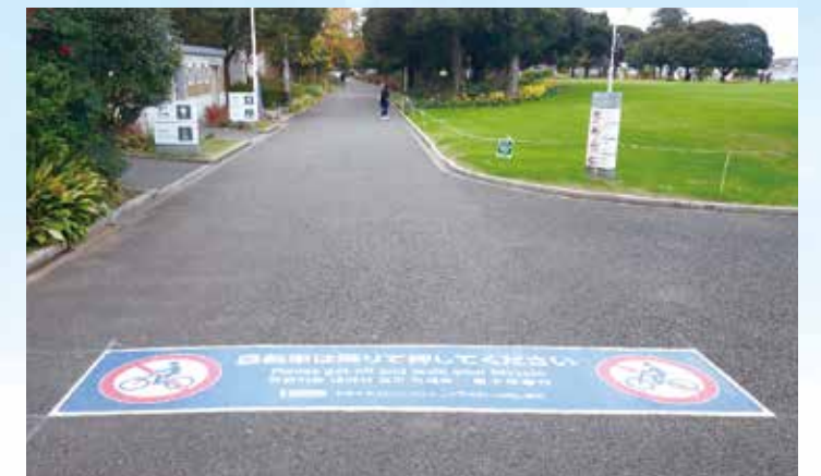
色鮮やかなタフディスプレイ®