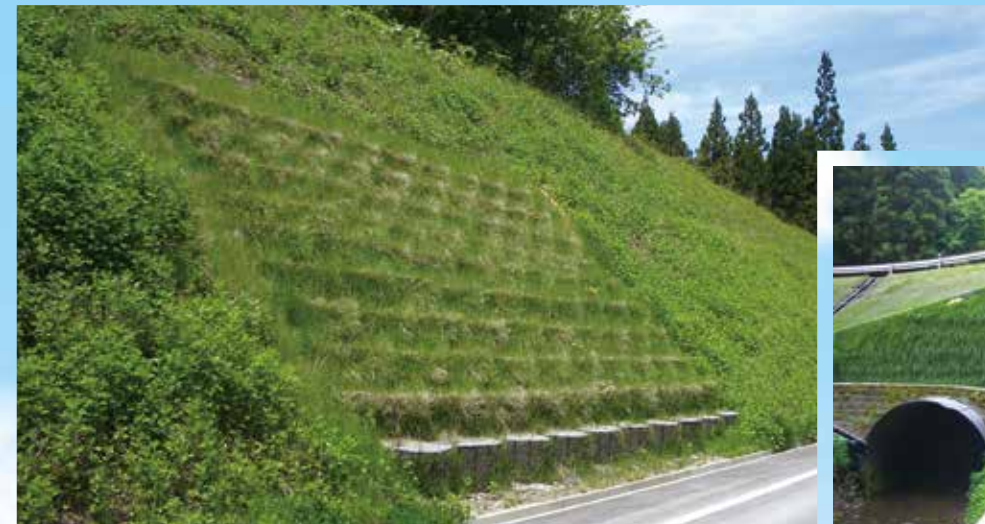
切土・盛土はテンサー® で補強と緑化