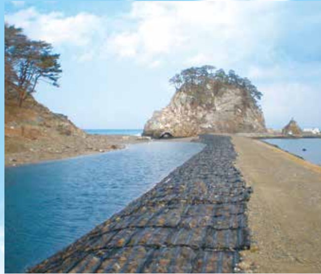
どこまでも続く護岸のジオシェルトン®