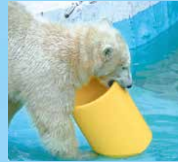
大口径ガスパイプと 戯れるシロクマ