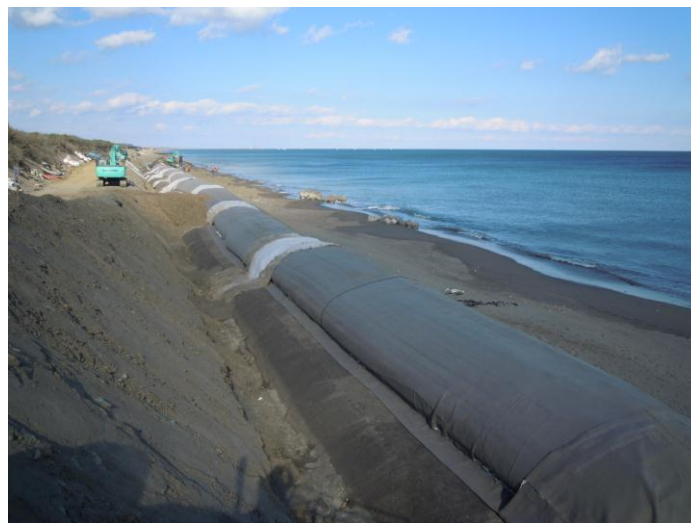
写真 - 使用例